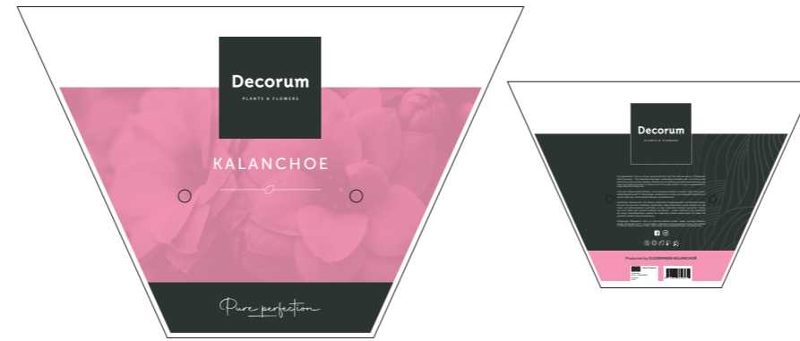
Ton-sur-ton / Mono color

* Voor ton-sur-ton kleurenschema, zie: https://brandmanualdecorum.nl/kleuren/